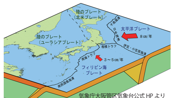
気象庁大阪管区気象台公式HPより トラフ：海溝より浅くて幅の広い、海底の溝状の地形。 南海トラフは、フィリピン海プレートがユーラシアプレートの下に潜り込んで形成されている。

その分、分かっている地震発生の仕組みは、ある程度の発生時期の予測もできています。それが南海トラフ地震です。2020年に発表された発生確率は、マグニチュード8.5〜9クラスが30年以内に70%〜80%です。この発表から4年になりますので、26年以内での発生確率です。しかも今回の能登半島地震クラスのマグニチュード7台及びそれ以下の大型地震であれば、その確率は上がります。